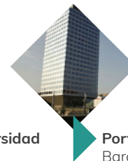
Porta Firal Barcelona