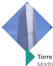
Torre de Cristal Madrid